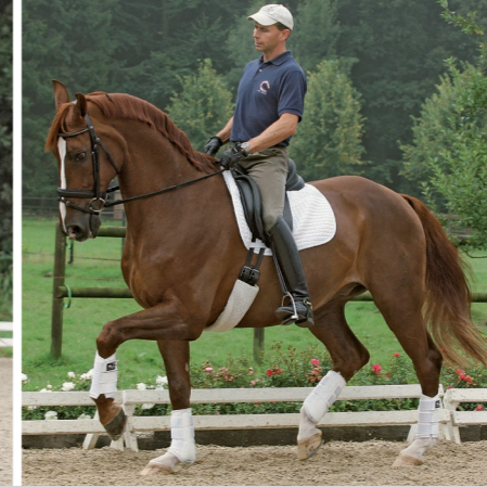
...entwickelt sich ausdrucksvoller Schwung.

als Gesundheitssport betreiben und damit ganz andere Lehr-Konzepte erforderlich machen. Auch vor diesem Hintergrund ist Weiterbildung für Ausbilder überlebenswichtig. Aber zurück zur Gegenwart. Derzeit krankt das System auch an zu vielen schlechten Berufsreitern, desillusionierten Reitlehrern und einer starken Fokussierung auf den Turniersport. Fast jeder, der gerade seine Bereiterlehre abgeschlossen hat, träumt von Erfolg, Ruhm und Geld. Die wenigsten investieren in ihre Gesellenzeit und lernen weiter. Stattdessen tingeln sie durch die Reitställe, ohne dabei an Qualitätssicherung und damit ihre eigene Zukunft zu denken. Zum Teil bestimmen finanzielle Zwänge diesen Weg (von irgendwas muss man ja nach dem mickrigen Lehrgeld leben), zum Teil sind es aber auch Überheblichkeit und Selbstüberschätzung, die den Ex-Lehrling gleich zum Ausbilder werden lassen. Tipp für Lehr-Absolventen: Mindestens ein Jahr lang bei einem Top-Ausbilder weiter lernen und sich auch danach weiterbilden! Tipp für Top-Ausbilder: Nutzen Sie die Gesellen nicht aus und honorieren Sie gute Arbeit mit gutem Geld – ein warmer Händedruck ist eine schöne Anerkennung, macht aber