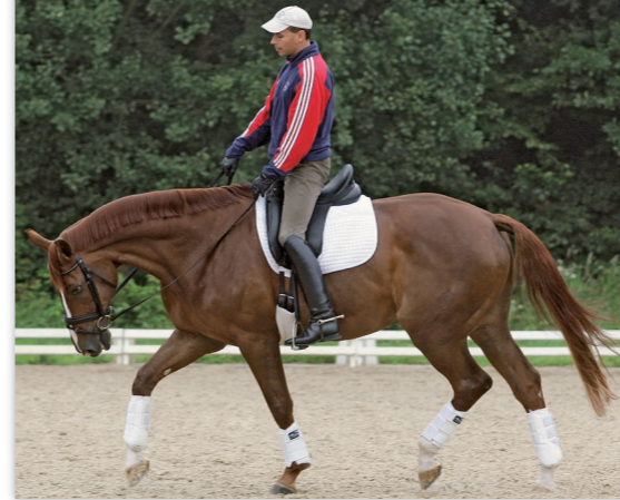
Aus losgelassenem Lösen (hier US-Reiter Steffen Peters auf Floriano)...

Bei sinkenden Geburtenzahlen, einer Vergrößerung der Gesellschaft verbunden mit täglich neu hinzukommenden Fun- oder pseudo-aktiven Computer-Sportarten wird sich das Kundenklientel verändern. Wo früher hauptsächlich reitsportbegeisterte Jugendliche die Reitställe bevölkerten und zum Turniersport strebten, werden künftig mehr und mehr erwachsene Spät- oder Wiedereinsteiger die Reitstunden besuchen, Reiten